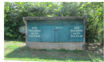
Subestación en la zona